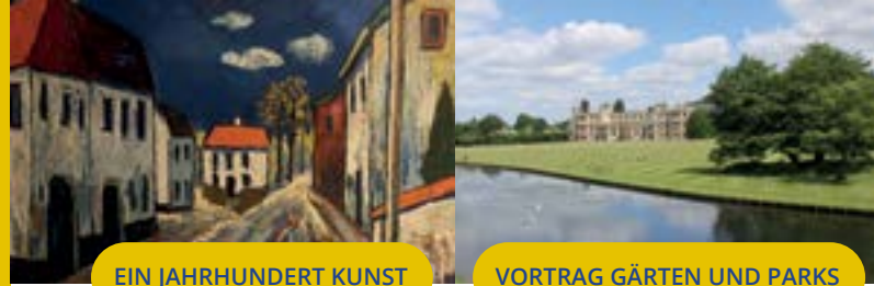
EIN JAHRHUNDERT KUNST